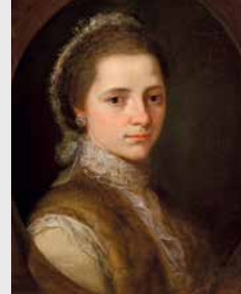
Angelika Kauffmann, Selbstbildnis mit Schmuckkränzchen, 1764/65, Privatsammlung A.&S.G.